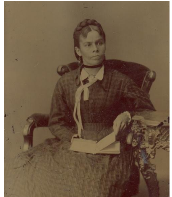
Nahneebahwequa (Catherine Sutton).